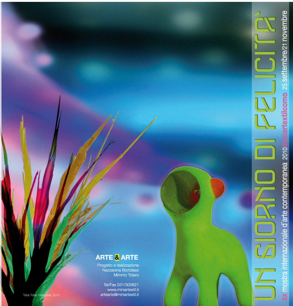
Toba Toba, Indivisible, 2010